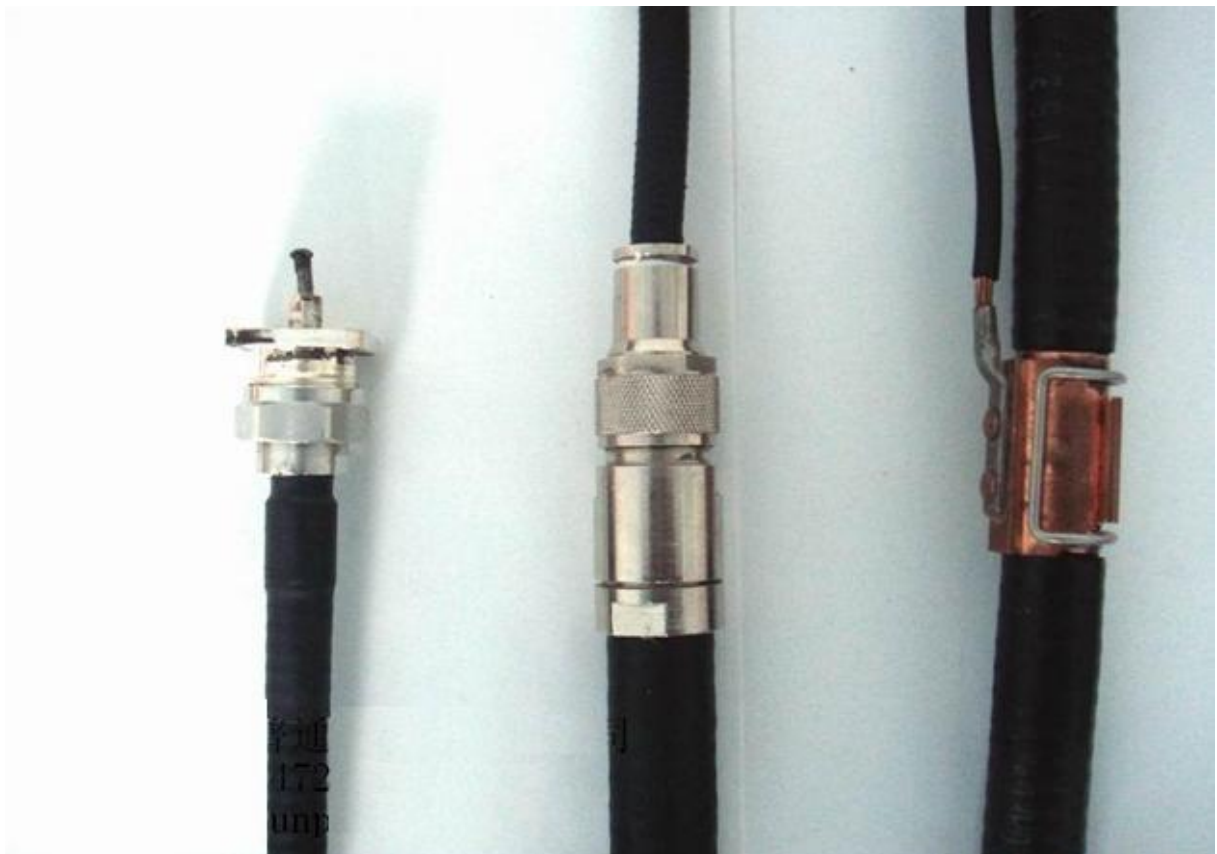
馈线接地的接线示意图。